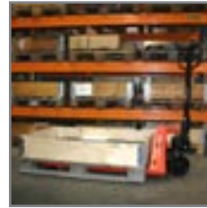
Εφαρμογή σε διαχείριση βαρέων αγαθών.