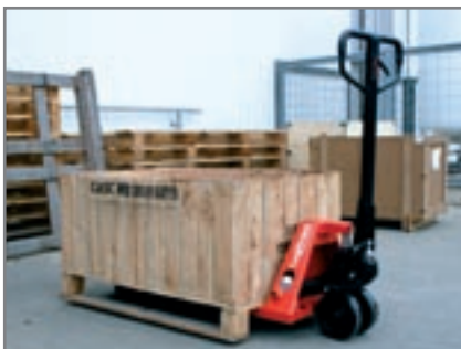
Εφαρμογή στη βιομηχανία συσκευασίας.