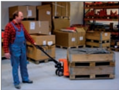
Εφαρμογή σε αποθήκη ανταλλακτικών.