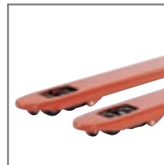
Απλός ή διπλός τροχός στο πιρούνι.