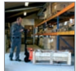
Εφαρμογή σε αποθηκευτικό χώρο.

Ρωτήστε μας για περισσότερες πληροφορίες.