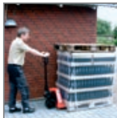
Μεταφορά παλέτας με μπουκάλια.