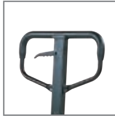
Η επικάλυψη από λάστιχο εξασφαλίζει την άνετη χρήση.