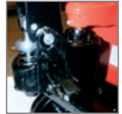
Αξιόπιστο και στεγανό υδραυλικό σύστημα.