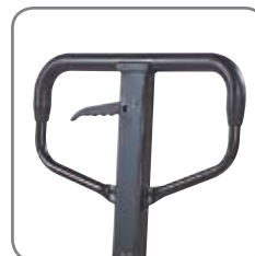
Το επενδεδυμένο με λάστιχο τιμόνι προσφέρει άνεση κατά τη χρήση.