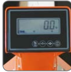
Ένδειξη σε lb ή kg.