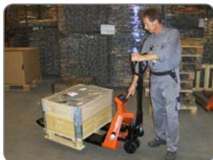
Εφαρμογή στη βιομηχανία.