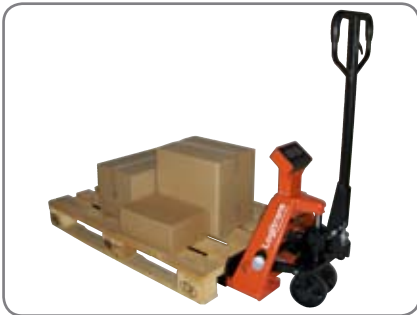
-Μεταφορά και ζύγιση στο ίδιο μηχάνημα.