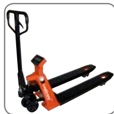
Αξιόπιστες ενδείξεις μέσω των 4 κυψελών ζύγισης.