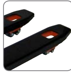
Η γωνία στροφής είναι 210°, επιτρέποντας ελιγμούς σε στενούς χώρους.