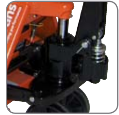
Στεγνό και αξιόπιστο υδραυλικό σύστημα.